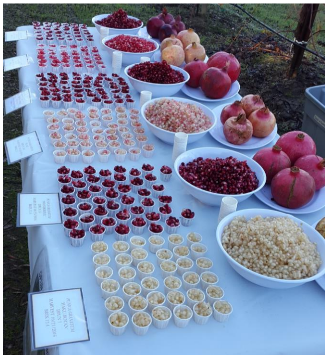
Slika 4: Razstava sort z različno barvo arilov pri granatnem jabolku.