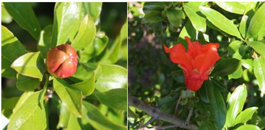
Slika 1: Zaprt cvet granatnega jabolka (levo) ter čašni in venčni listi granatnega jabolka (desno).

Najboljši plodovi nastanejo iz zgodnjih cvetov, verjetno zaradi tega, ker se razvijejo v bolj ugodnih okoljskih razmerah (Evreinoff, 1953). Kasneje oplojeni cvetovi zaradi prihoda jeseni ne uspejo dozoreti. Cvetovi se razvijejo na starejših in na toletnih, večinoma kratkih poganjkih, približno en mesec po brstenju. V južnejših delih severne poloble cvetenje nastopi v aprilu in maju, pri nas konec maja oz. junija in lahko traja še celo poletje. Terminalno se cvetovi pojavljajo v šopih, medtem ko se vzdolž rodnega nosilca na kratkih poganjkih razvijejo posamični cvetovi (Holland in sod., 2009).