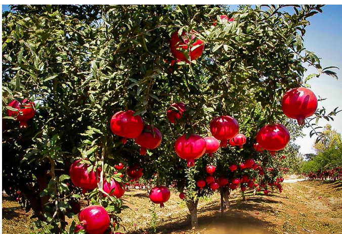
Slika 10: Granatno jabolko sorta 'Wonderful'.

Za oblikovanje sortnega izbora granatnega jabolka sta osnova videz zrelih plodov (velikost, barva), notranjost ploda (barva zrn) in kakovost ploda (vsebnost sladkorjev in kislost). Poznanih naj bi bilo več kot 500 sort granatnega jabolka. Ena najbolj razširjenih sort na svetu je sorta 'Wonderful' (Slika 10), ki se jo uporablja tako za presno uporabo, kot za izdelovanje soka. Priljubljena je predvsem zaradi nizke vsebnosti kislin in zaradi visokega deleža sladkorja (Giving trees, 2018).