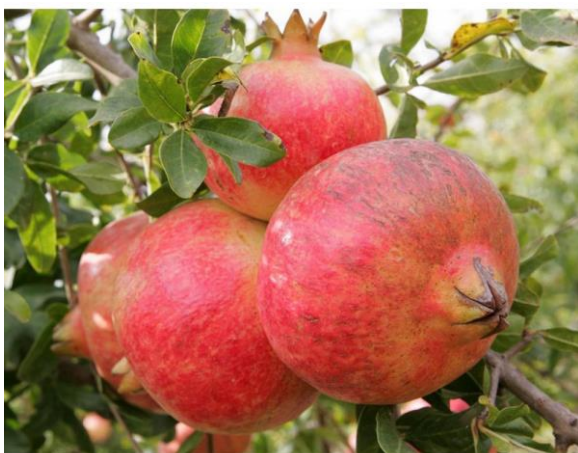
Slika 11: Granatno jabolko sorte 'Early Mollar de Elche' ( http://www.shop.zahradnictvolimbach.sk/en/mollar-de-elche-pomegranate ).

Za eno najbolj sladkih sort velja sorta 'Early Mollar de Elche' (Slika 11), ki ima zelo mehke arile in je zelo popularna v Evropi in v Španiji, od koder naj bi tudi izhajala. Se bolje skladišči glede na druge sorte granatnega jabolka, uporablja pa se jo za sok in presno uporabo, saj vsebuje veliko antioksidantov, vitaminov in mineralov (Giving trees, 2018).