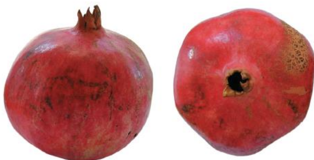
Slika 15: Plod granatnega jabolka sorte 'Pastun' (Radunič in sod., 2012).

Sorta 'Pastun' (Slika 15) nima znanega porekla. Na Hrvaškem se to sorto goji v dolini reke Neretve, v okolici Dubrovnika, na območju Bosne in Hercegovine ter Boke kotorske v Črni gori. Plod je rdeče barve in prav tako zrna, je sladko kislega okusa (Radunič in sod., 2012).