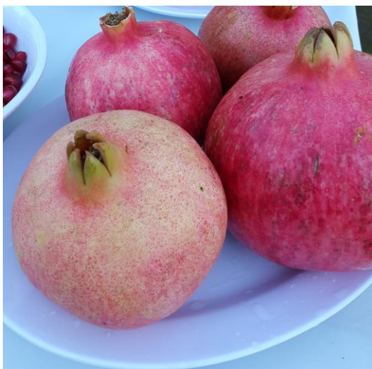
Slika 2: Plod granatnega jabolka.

Lupina ploda ali eksokarp ploda je usnjat, gladek, trden, od rjavih do rumenih in rdečih odtenkov. Notranjost ploda ali mezokarp je razdeljen v več prekatov. Prekati so med sabo ločeni s tanko membrano, ki je iz zelo tankega tkiva (Slika 3). V vsakem prekatu je veliko semen, prekati so razporejeni nesimetrično. Najpogosteje spodnji del ploda vsebuje dva do tri prekate, zgornji del pa šest do devet. V posameznem prekatu se nahaja veliko števil zrn ali arilov (zrno sestavlja seme, obdano z ovojnico, ki je mesnato in vsebuje sok, ki je obarvan od rahlo rumenkasto-bele do rdeče barve (Slika 4) (Lawrence, 1951; Purseglove, 1968; Anonymous, 1969; Dahlgren in Throne, 1984; Holland in sod., 2009; Teixeirira da Silva, 2013). Sok, ki ga granatno jabolko vsebuje je lahko kiselkast ali sladek, odvisno od sorte. Plod po cvetenju zori in dozori približno čez 6-7 mesecev (Morton, 1987).