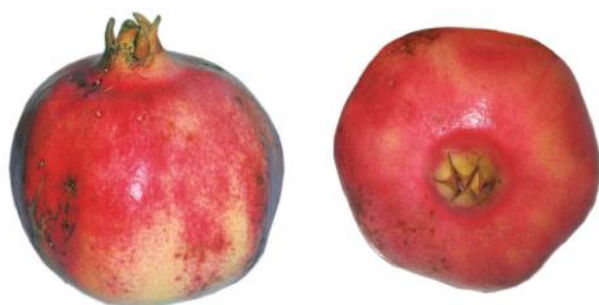
Slika 13: Zrel plod granatnega jabolka sorte 'Ciparski' (Radunič in sod., 2012).

Sorta 'Ciparski' (Slika 13) je sorta iz Cipra, ki so jo prinesli na Hrvaško in se jo goji sedaj na območju reke Neretve. Gre za sorto, ki ima povrhnjico svetlo rumene barve na zgornjem delu in rdeče barve na spodnjem, zrna pa so temno rdeče barve in sladka (Radunič in sod., 2012).