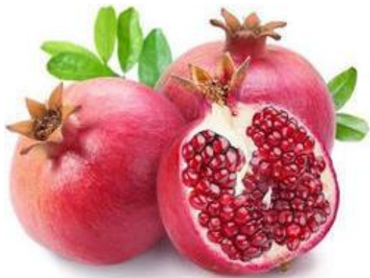
Slika 12: Zrel plod granatnega jabolka sorte 'Baghwa' ( https://dir.indiamart.com/nashik/fresh-pomegranates.html ).

V Indiji je najbolj popularna sorta 'Baghwa' (Slika 12), znana tudi pod imenom 'Kesar'. Velja za bolj odporno sorto na glive, ki povzročajo venenje dreves. Je dobro obstojna pri transportu in primerna za sveže uživanje ali za predelavo v sok (Giving trees, 2018).