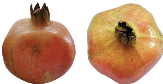
Slika 14: Sorta granatnega jabolka 'Konjski zob' (Radunič in sod., 2012).

Sorta 'Pastun' (Slika 15) nima znanega porekla. Na Hrvaškem se to sorto goji v dolini reke Neretve, v okolici Dubrovnika, na območju Bosne in Hercegovine ter Boke kotorske v Črni gori. Plod je rdeče barve in prav tako zrna, je sladko kislega okusa (Radunič in sod., 2012).