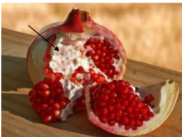
Slika 3: Prerezan plod granatnega jabolka, na katerem je vidna tanka membrana, ki ločuje prekate z arili (Glozer in Ferguson, 2008).

Lupina ploda ali eksokarp ploda je usnjat, gladek, trden, od rjavih do rumenih in rdečih odtenkov. Notranjost ploda ali mezokarp je razdeljen v več prekatov. Prekati so med sabo ločeni s tanko membrano, ki je iz zelo tankega tkiva (Slika 3). V vsakem prekatu je veliko semen, prekati so razporejeni nesimetrično. Najpogosteje spodnji del ploda vsebuje dva do tri prekate, zgornji del pa šest do devet. V posameznem prekatu se nahaja veliko števil zrn ali arilov (zrno sestavlja seme, obdano z ovojnico, ki je mesnato in vsebuje sok, ki je obarvan od rahlo rumenkasto-bele do rdeče barve (Slika 4) (Lawrence, 1951; Purseglove, 1968; Anonymous, 1969; Dahlgren in Throne, 1984; Holland in sod., 2009; Teixeirira da Silva, 2013). Sok, ki ga granatno jabolko vsebuje je lahko kiselkast ali sladek, odvisno od sorte. Plod po cvetenju zori in dozori približno čez 6-7 mesecev (Morton, 1987).