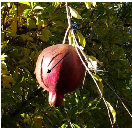
Slika 8: Pokanje plodov.

Poškodbo plodov lahko povzročajo različni škodljivci, kot so hrošči Leptoglossus sp. (Slika 9), listne uši ( Aphidoidea ), če so prisotne v večjih količinah, pršice ( Acari ) in vsejedi črvi.