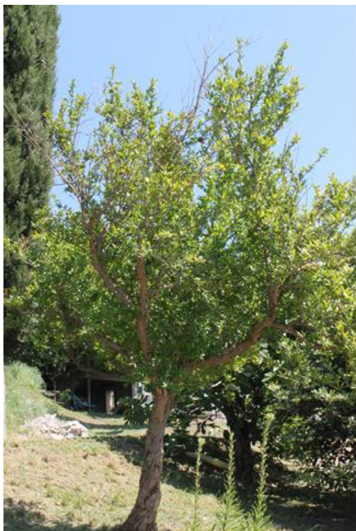
Slika 5: Granatno jabolko v obliki drevesa (Foto: Alenka A. Baruca).

Pawar in sod. (1994) so pri proučevanju rezi granatnega jabolka prišli do ugotovitve, da rez vpliva na kakovost plodov, na velikost plodov, vsebnost soka ter na večjo hektarsko donosnost nasada. Blumenfeld in sod. (2000) poročajo, da se pri zimski rezi prikrajšuje vrhove, za vzdrževanje zelene višine dreves, odstranjuje polomljene, premočno upognjene in odvečne veje, s poletno rezjo pa se zagotavlja primerno osvetljenost krošnje. MacLean in sod. (2017) poročajo, da se rodni les razvije na dve do tri leta starih poganjkih. Glavni del rezi je najbolje opraviti v zimskem času oziroma pred pojavom prvih cvetov.