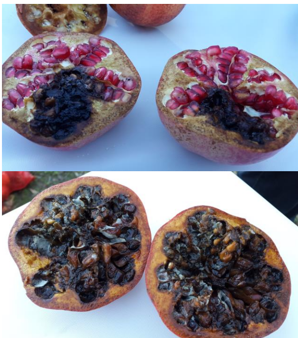
Slika 9: Poškodba ploda po napadu hrošča Leptoglossus sp..

Ena glavnih bolezní je venenje, ki je prisotna v vseh večjih pridelovalnih območjih granatnega jabolka v Indiji. Venenje povzroča gliva Ceratocystis fimbriata (Anonymous 2007, 2008, 2009), ki naj ne bi bila edini vzrok venenja. Raziskave kažejo, da so povzročitelji tudi glive iz rodu Fusarium spp., ogljena trohnoba soje ( Macrophomina phaseolina ) in glive Rhizoctonia bataticola , Rosellinia necatrix in Verticillium dahliae . Venenje lahko povzročajo tudi ogorčice koreninskih šišč ( Meloidogyne incognita ) ter oomiceta ( Phytophthora spp.) (Anonymous 2008, 2009; Sztejnberg in Madar 1979; Tziros in Tzavella-Klonari, 2008).