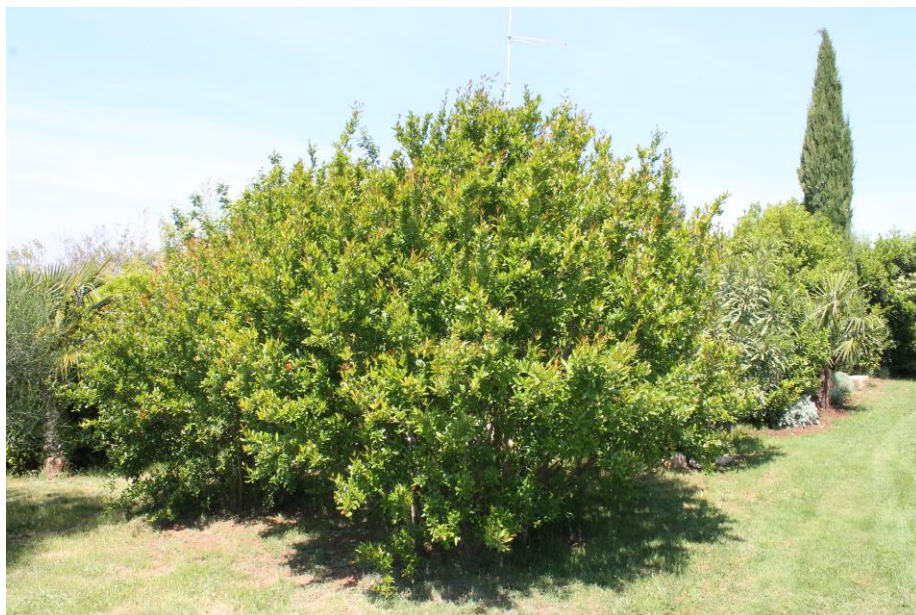
Slika 6: Granatno jabolko v obliki grma.