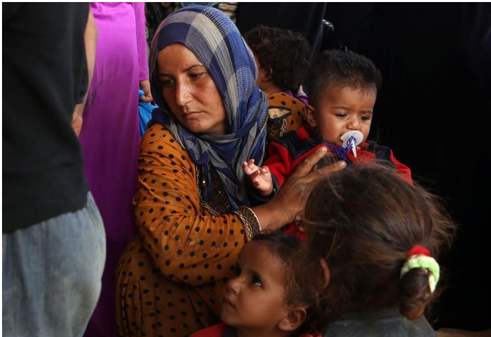
Slika 3.01. Begunka z otroki.